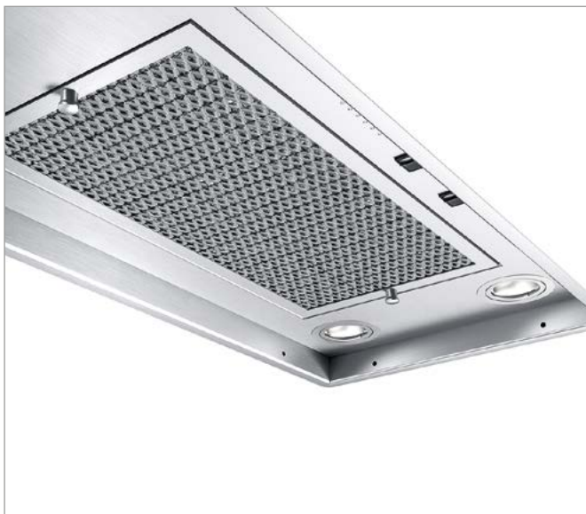
Beispielhafte Darstellung. Exemplary representation.