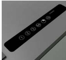
Glas Bedienpanel / glass control panel

The development of this “Invisible” system effectively reflects the challenges of letting go of all the influences of bygone traditions and of actualising concepts belonging to the future, in the now. This invisible extraction unit represents our enthusiasm for creative solutions and our passion and commitment to technical innovations. The experience of visual freedom in the kitchen living spaces combined with the absolute certainty of a highly functional system that can also be deployed as an oven and/or steam oven extraction system, is truly satisfactory.